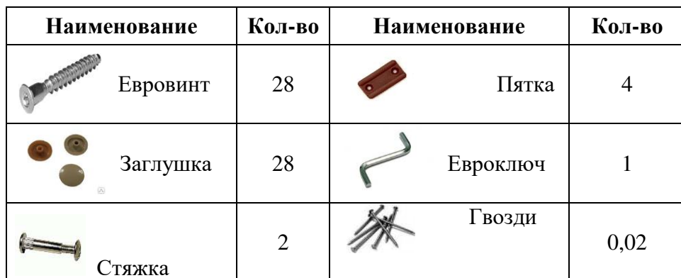
Таблица комплектации деталей