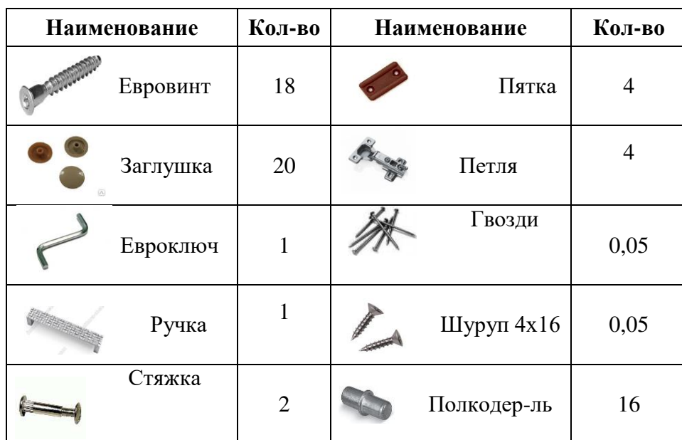
Таблица комплектации деталей